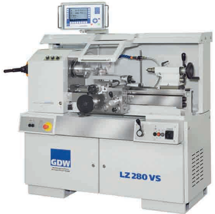
Drehzahlbereich 5000 U/min, Antrieb über außen liegende Riemen zu Hauptspindel: LZ280VS .

Mit den Produkten LZ280VS und LZ400VS präsentieren wir zwei neu entwickelte Leit- und Zugspindeldrehmaschinen mit stufenlos regelbarem Hauptantrieb aus dem Hause GDW . Der Leit- und Zugspindeltrieb erfolgt über ein wartungsfreies Verteilergetriebe mit hauptspindelsynchronisiertem Servomotor. Die erforderlichen Vorschub- und Gewindeeingaben finden über das Bedienterminal statt. Ein wartungsfreier Drehstrom-Asynchronmotor (mit angebautes Bremsmodul und strom- und drehzahlgeregeltem Frequenzumrichter mit Istwert-Rückführung) sorgt für kurze Brems- und Hochlaufzeiten bis zur maximalen Spindeldrehzahl und lastunabhängige konstante Drehzahl. Ein modernes und übersichtliches Bedienterminal, das die Arbeit erleichtert und zusätzlichen Komfort bietet, erlaubt eine besonders einfache und sichere Bedienung. Die Maschinen enthalten ein integriertes Diagnosesystem, das Störungen und Zustandsmeldungen im Klartext ausgibt, und nicht zuletzt ein umfangreiches Sicherheitspaket.