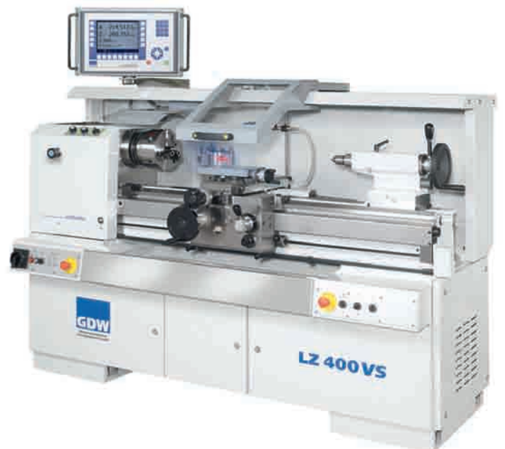
Getriebespindelkasten mit Vorgelege für hohe Drehmomente an der feingewuchteten Hauptspindel: LZ400VS .